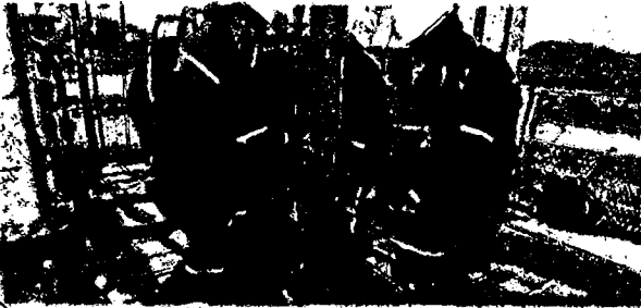
DE CONTINUAR la crisis de los precios en el sector petrolero, en el país se perderían hasta 25 mil puestos. IKS

● Si continúa la crisis de precios del crudo, se podrían perder hasta 25 mil puestos